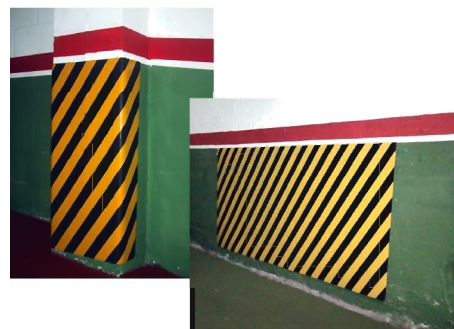
Piezas a medida.

Es un producto muy versátil, con muy diversas aplicaciones: