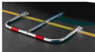
Cierre con candado RA-30