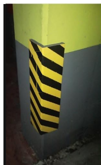
PRT10030.AMN Espesor 20 mm, 700*300 Válido tanto para esquinera como para tope protector

Fabricados en espuma NO inflamable. Comportamiento al fuego según EN 13 501-1:2002 : B2 Provisto de adhesivo extrafuerte. Instalación rápida y limpia.