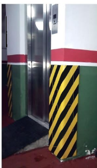
PRT10220.AMN Espesor 10 mm, 900*200 Esquinera