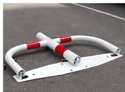
Cierre con llave RA-10