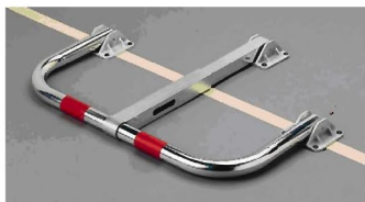
Cierre con llave RA-20